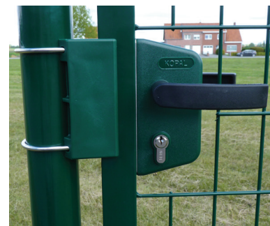
Boîte à serrure et poignée du portillon Grace