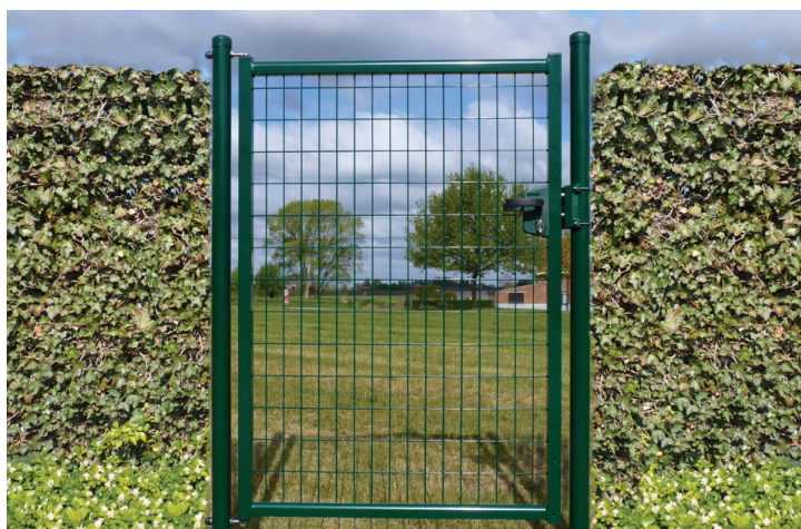
Portillon Grace modèle 2013